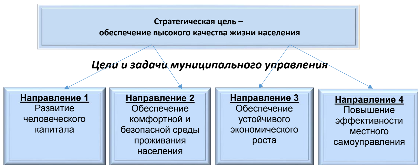
Рис. 4. «Дерево целей» социально-экономического развития ЗАТО г. Североморск

На основе результатов анализа и выбранного сценария социально-экономического развития муниципалитета сформировано «дерево целей», включающее стратегическую цель, стратегические направления, а также задачи, направленные на достижение стратегической цели.